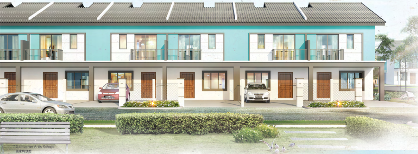
*Gambaran Artis Sahaja 画家构思图