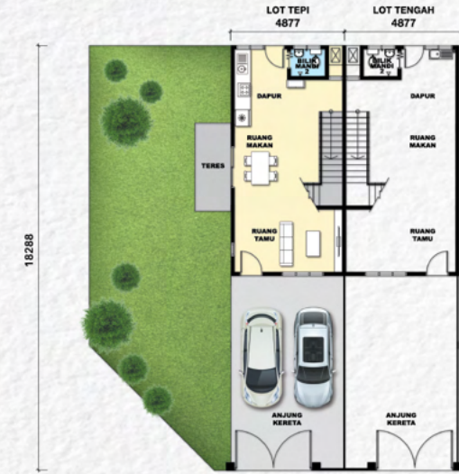
Tingkat Bawah 底楼