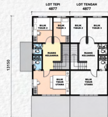
Tingkat Satu 一楼