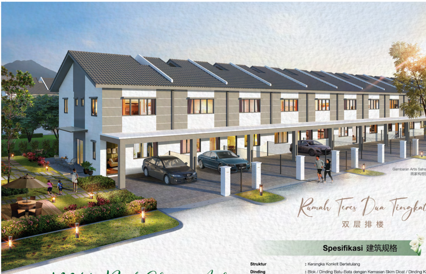
Gambaran Artis Sahaja 画家构思图