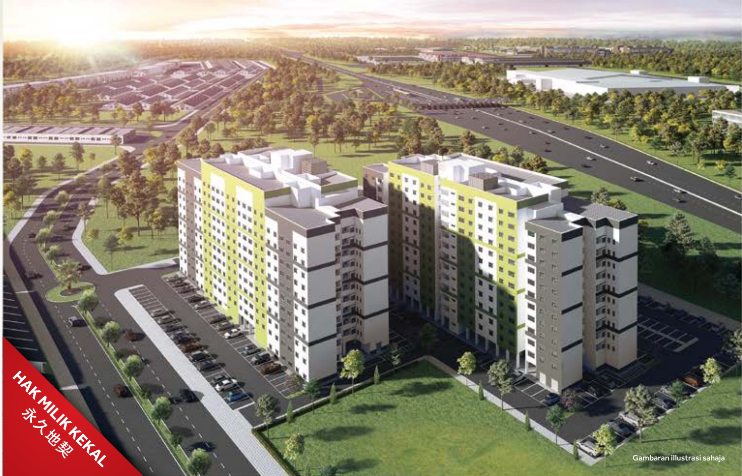
Gambaran ilustrasi sahaja