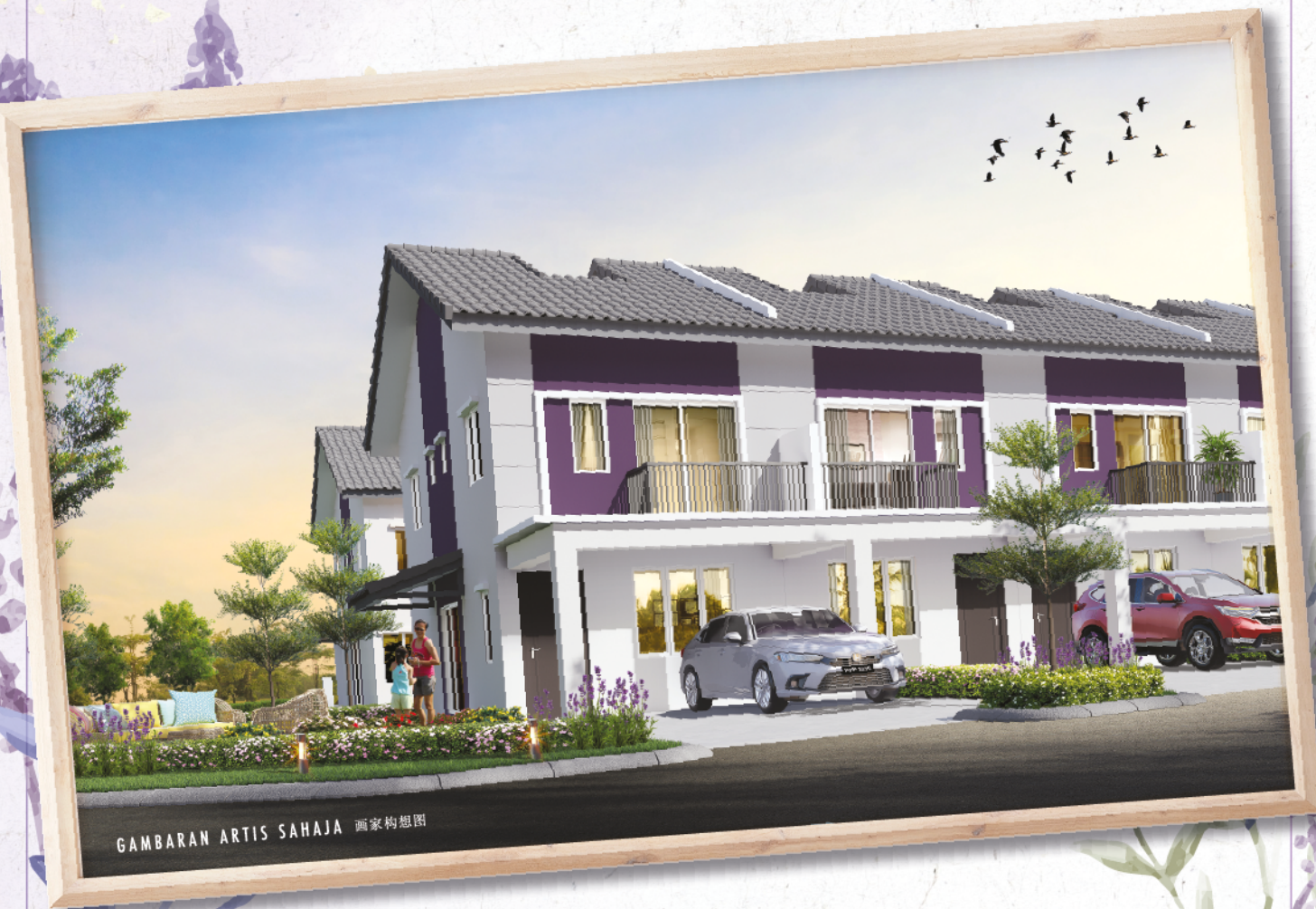
GAMBARAN ARTIS SAHAJA 画家构思图

RUMAH BERTANAH - HAK MILIK KEKAL 永久地契 有地房产