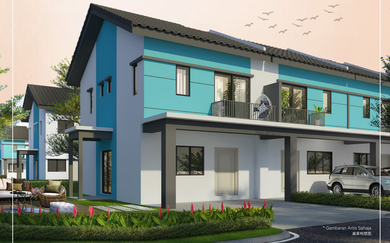
* Gambaran Artis Sahaja 画家构想图

Scientex Sungai Petani 是马来西亚北部地区的一个房地产项目，位于吉打州双溪大年，共开发 161.1 英亩涉及住宅和商业的综合城市化项目。