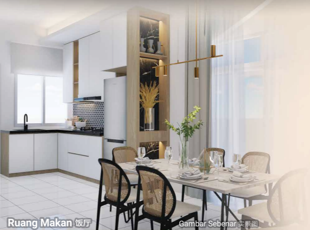
Ruang Makan 饭厅 Gambar Sebenar 实景图