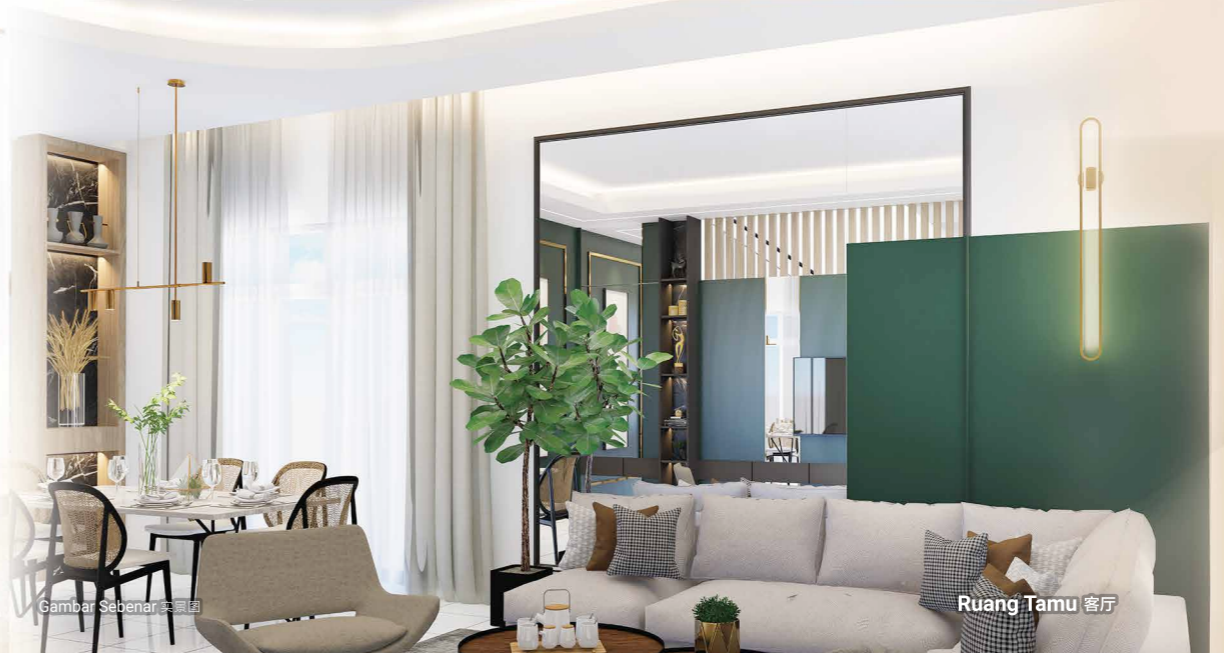
Gambar Sebenar 实景图 Ruang Tamu 客厅