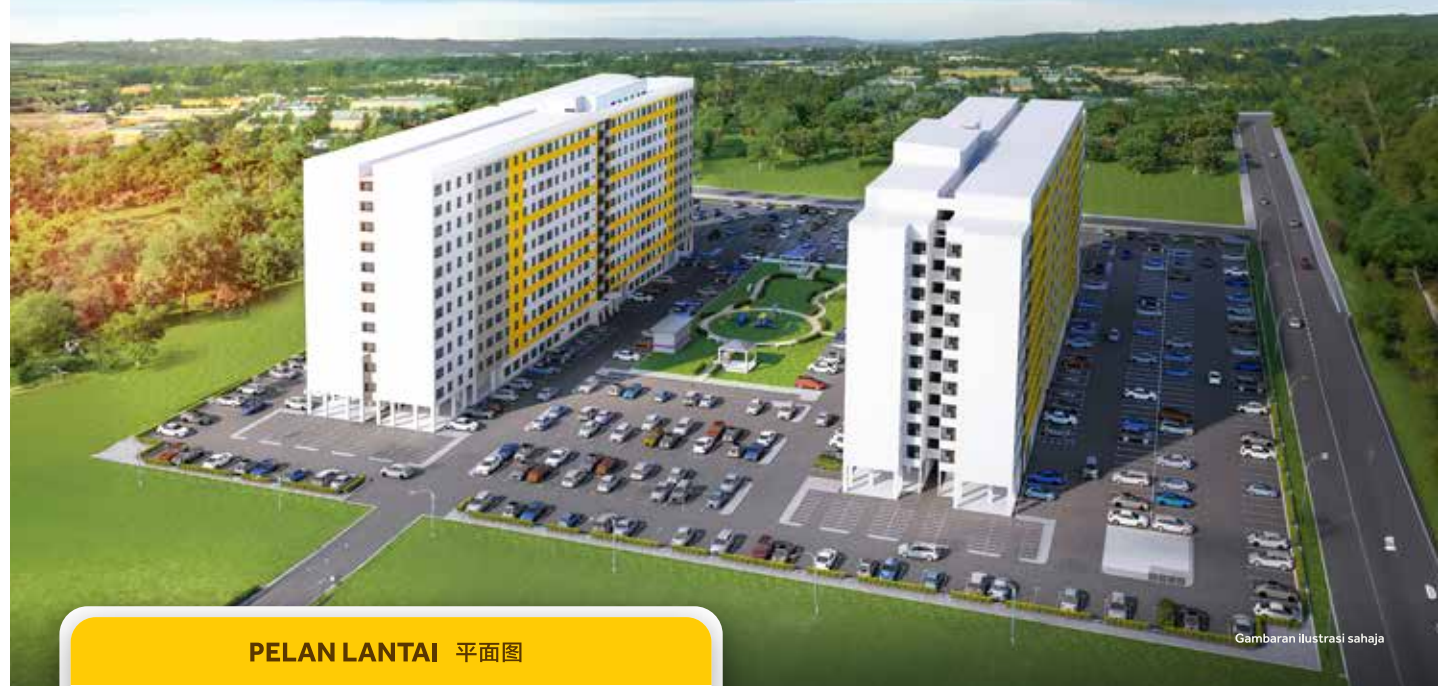
Gambaran ilustrasi sahaja